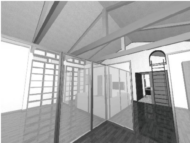
新型金物採用により小屋梁を飛ばせるので広い間取りを実現できます。